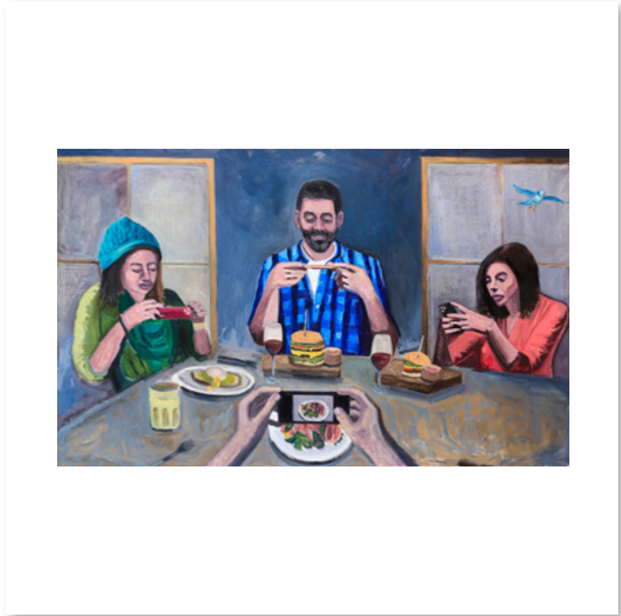
Foodtography Óleo sobre lienzo | oil on canvas 158 x 98 cm 2024

El contraste entre el mundo real y lo que se muestra. The contrast between the real world and what is presented.