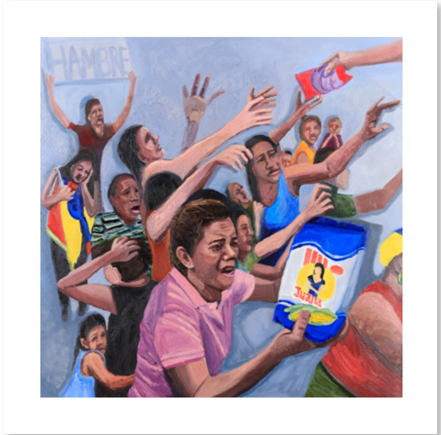
Hambre Óleo sobre lienzo | oil on canvas 97 x 97 cm 2024

Una desesperante escena de personas enfrentando el hambre, reflejando una realidad injusta que no debería existir. A harrowing scene of people facing hunger, reflecting an unjust reality that should not exist.