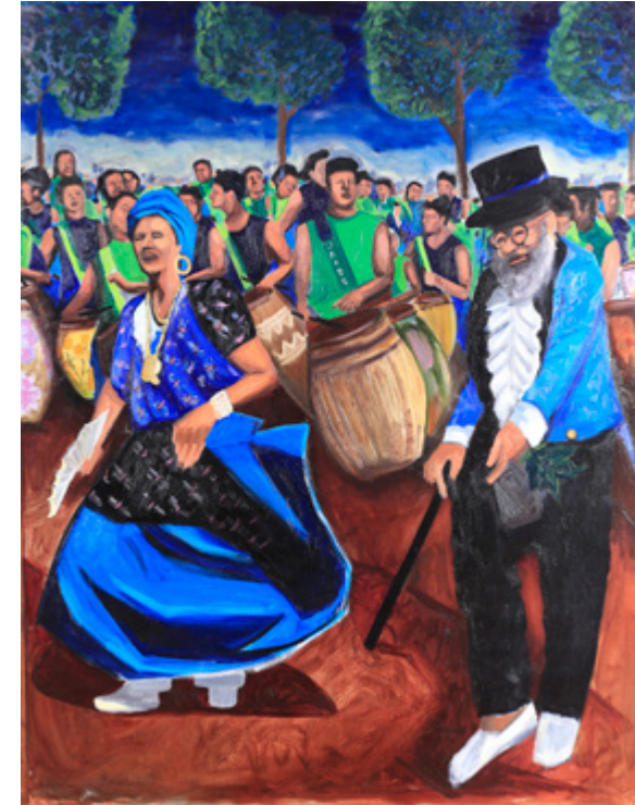
Cuerda de tambores