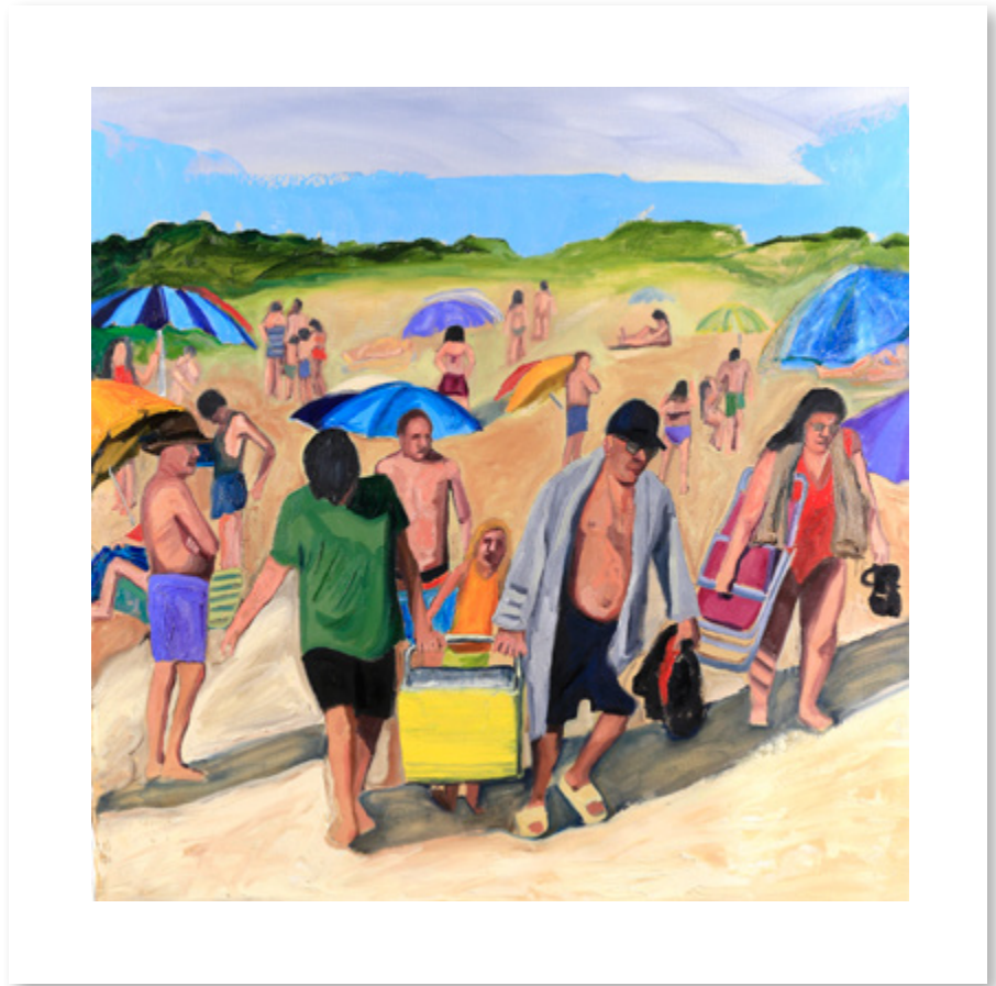
Médanos Óleo sobre lienzo | oil on canvas 100 x 97 cm 2024

La cotidianidad de un día de playa en familia. The everyday life of a family day at the beach.